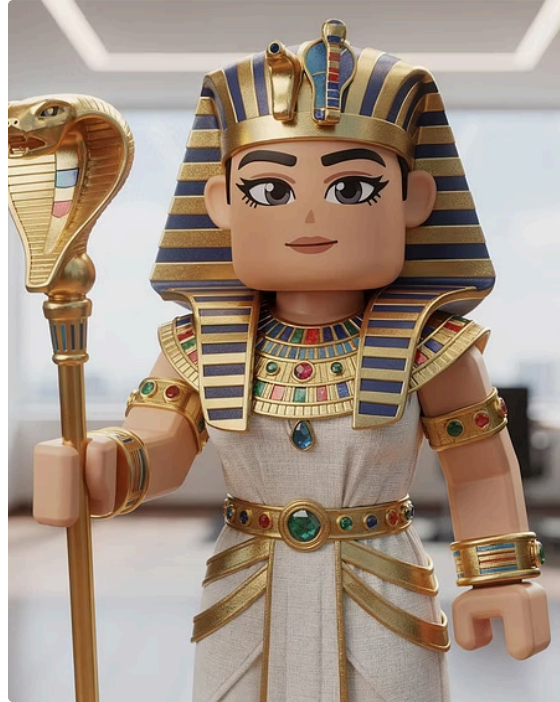
Hatshepsut la Regina

Il faraone più famoso, regnò 66 anni e combatté tante battaglie. Costruì templi enormi come Abu Simbel