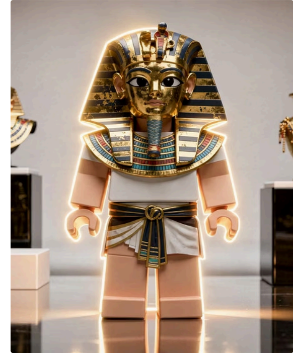
Tutankhamon il Giovane

Una donna faraone eccezionale! Portò pace e prosperità, organizzò spedizioni commerciali verso terre lontane