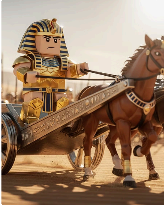
Ramses II il Grande

Il faraone più famoso, regnò 66 anni e combatté tante battaglie. Costruì templi enormi come Abu Simbel